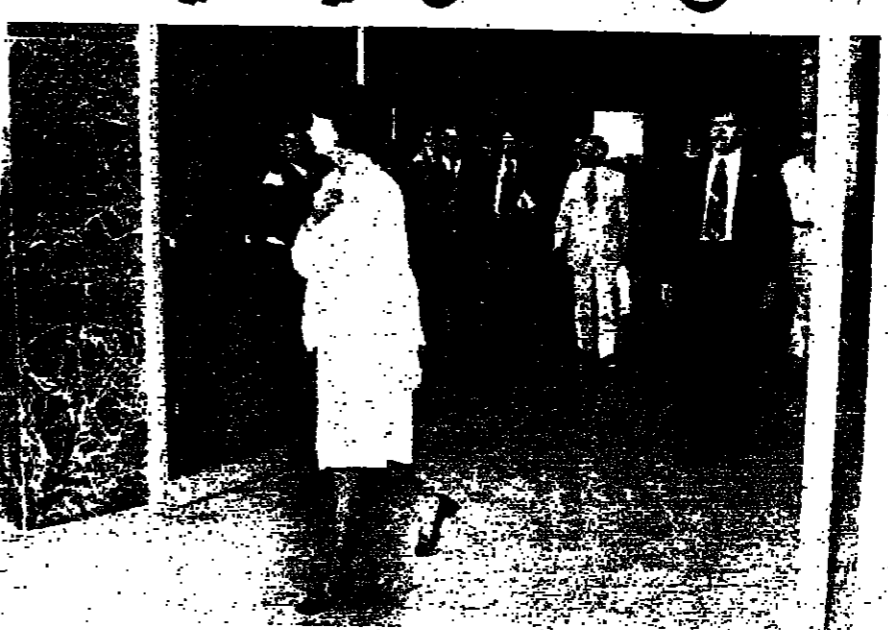
الانسة جون المسلوقة عن امن وحراسة الوزير فانس تتقدم اعضاء الوفدين في قصر بيضا